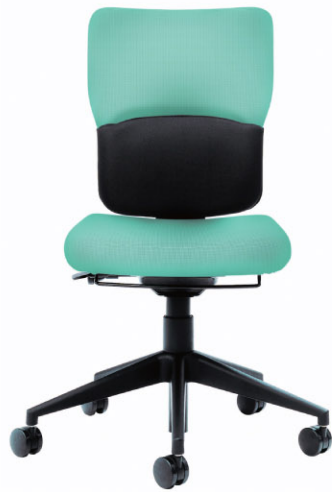
ミッドバック/ハイバック (アームレス)