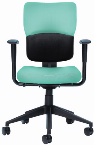
ミッドバック/ハイバック (アーム付き)